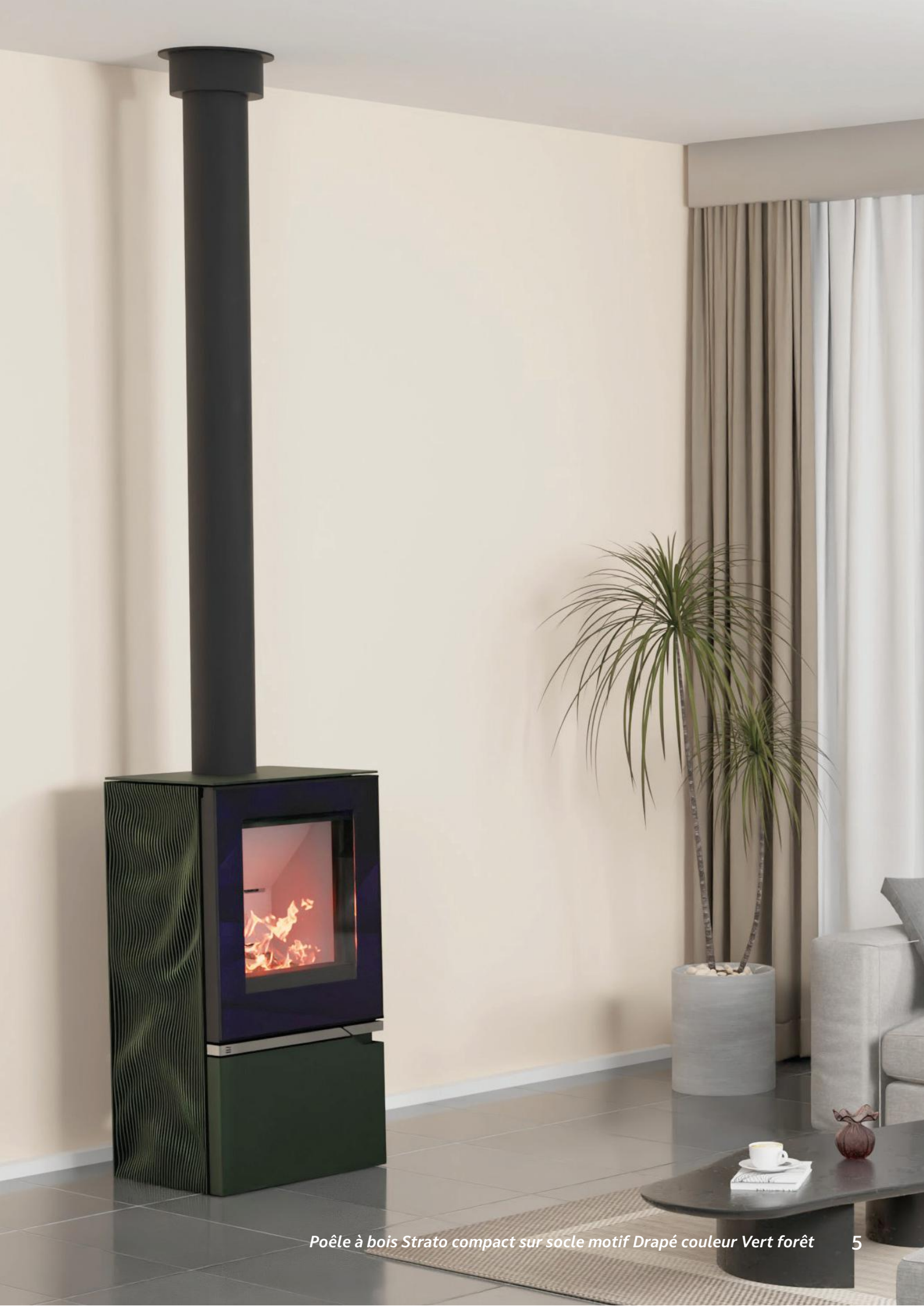
Poêle à bois Strato compact sur socle motif Drapé couleur Vert forêt