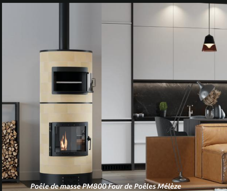
Poêle de masse PM800 Four de Poêles Mèlèze