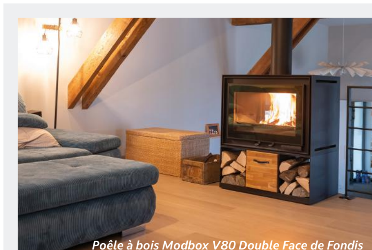
Poêle à bois Modbox V80 Double Face de Fondis

6 Basée sur un partenariat de confiance.