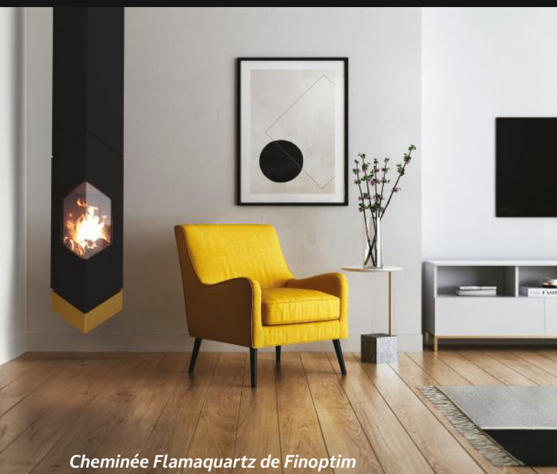
Cheminée Flamaquartz de Finoptim