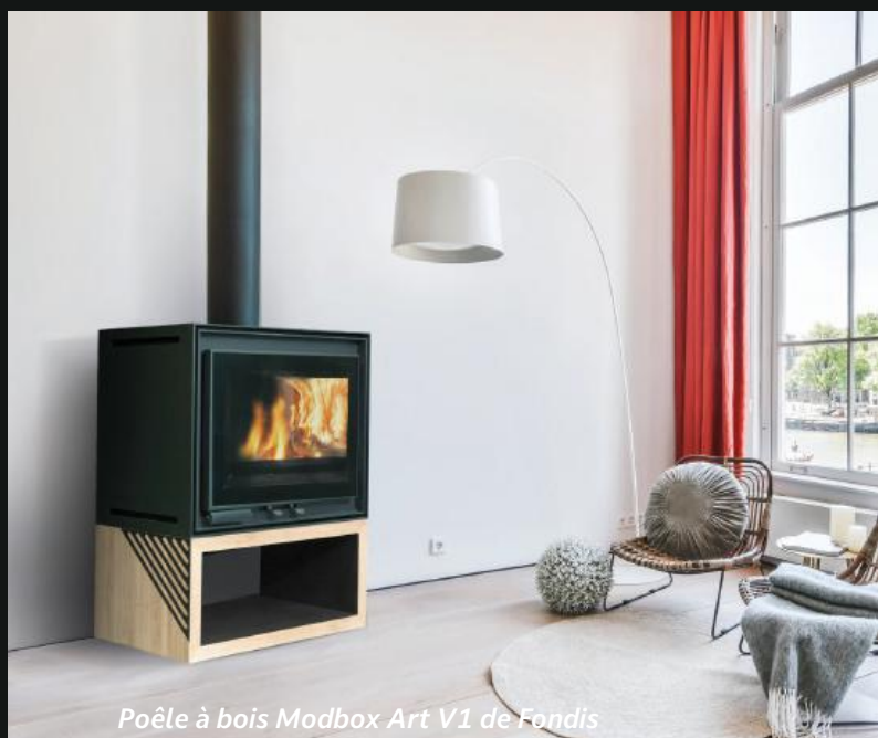
Poêle à bois Modbox Art V1 de Fondis