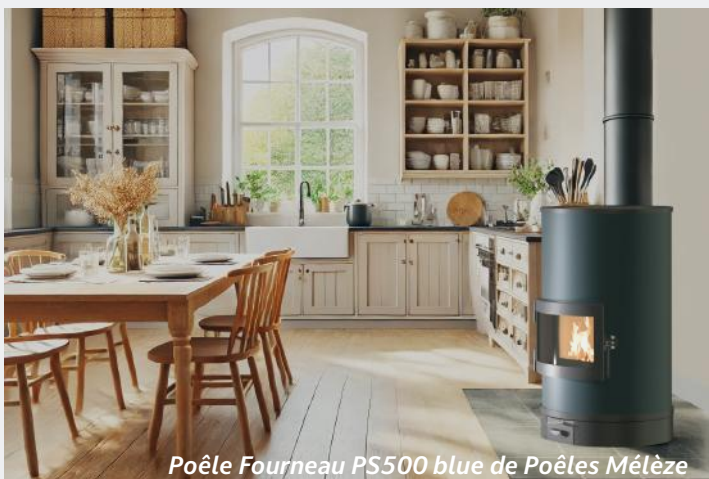
Poêle Fourneau PS500 bleue de Poêles Mélèze