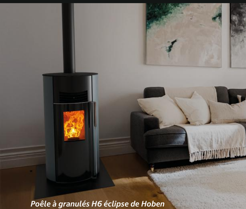
Poêle à granulés H6 éclipse de Hoben