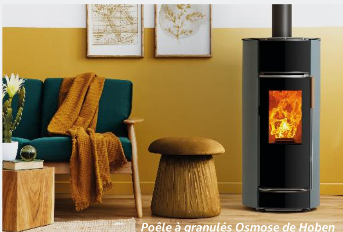
Poêle à granulés Osmose de Hoben